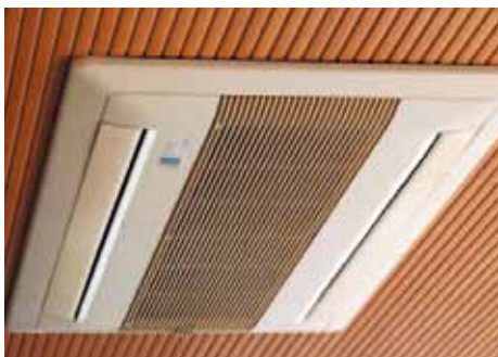
2方向天井埋込エアコン 24,800円~