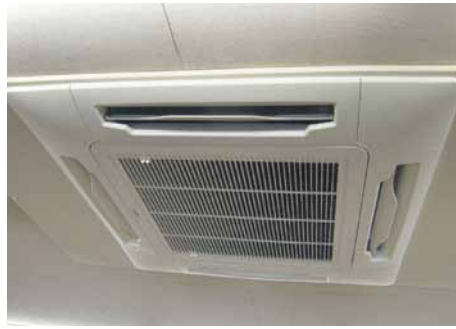
4方向天井埋込エアコン 24,800円~