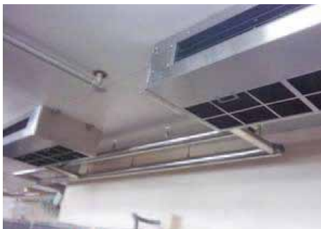
厨房用エアコン 39,800円~