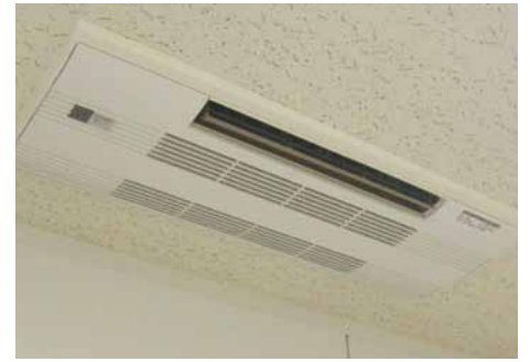
1方向天井埋込エアコン 24,800円~