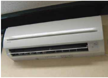
壁掛エアコン(20cm迄) 13,800円~